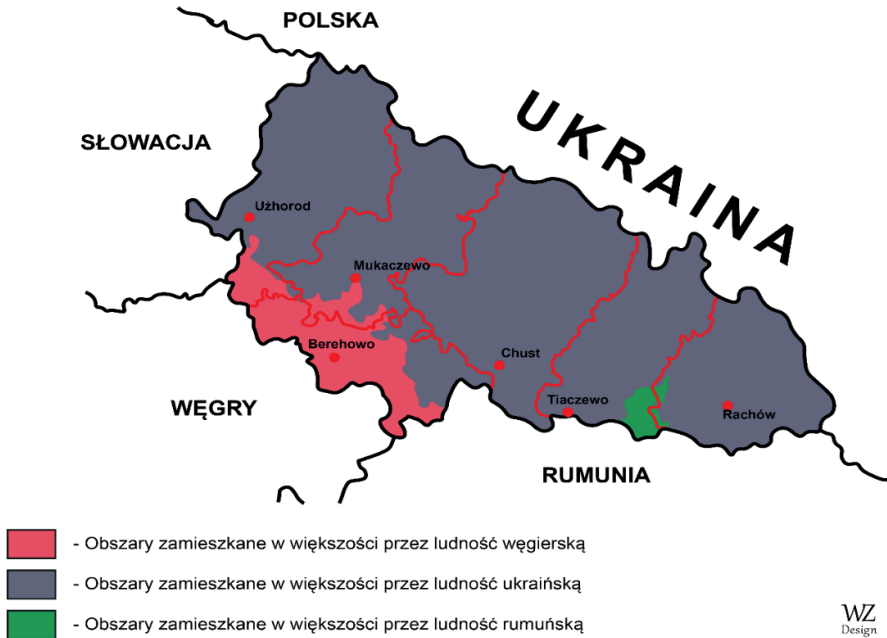
Mapa Obwodu Zakarpackiego z oznaczeniem zasięgu populacji ukraińskiej, węgierskiej oraz rumuńskiej

Dla zobrazowania panujących stosunków narodowościowych obwodu zakarpackiego obszar występowania trzech największych pod względem liczebności populacji: ukraińskiej, węgierskiej oraz rumuńskiej naniesiono na mapę obwodu.